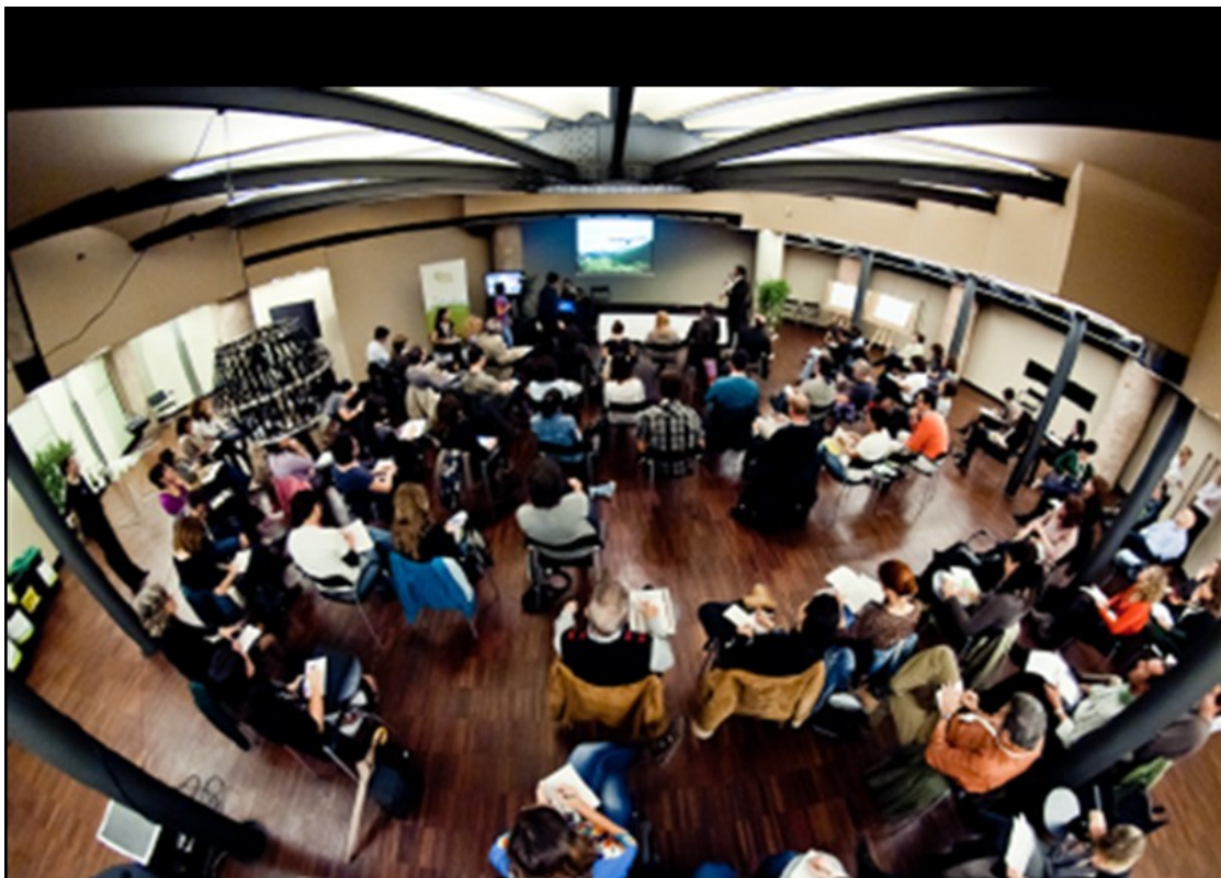
1. Taller Producto Turístico Responsable con 90 Empresas de Cataluña, 2012, La Pedrera (Bcn). Proyecto eCOTURAL (Fundación Biodiversidad)

El enfoque regional del proyecto implica diseñar una comunicación inteligente a través del uso de las TICs e Internet para ampliar el acceso a información de destinatarios al conjunto de acciones presenciales (talleres y sesiones de asesoramiento).