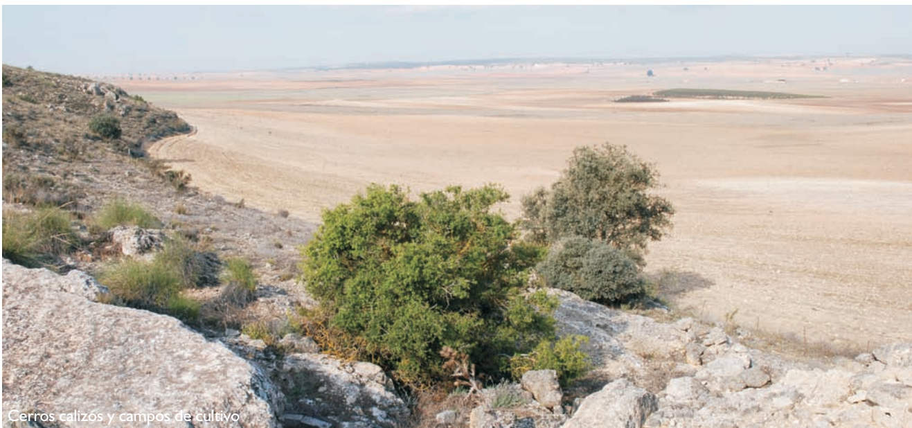
Cerros calizos y campos de cultivo

Las áreas y paisajes esteparios en general son muy valorados en el contexto europeo, por ser paisajes muy escasos y originales. Su valor añadido reside en su gran interés para las aves esteparias, tanto por la diversidad de especies y cuantía de sus poblaciones, como por su distribución marginal, en el límite oriental del territorio de Castilla-La Mancha e ibérico. Destacan las poblaciones de avutarda que se asientan en todas las zonas delimitadas como ZEPA, así como las poblaciones de sisón y ortega existentes en las áreas esteparias de Hoya-Gonzalo, Higuera, Almansa y Montealegre del Castillo, y la población de alcaraván de esta última área esteparia.