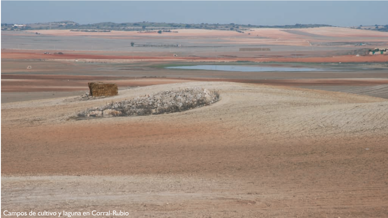
Campos de cultivo y laguna en Corral-Rubio

En las llanadas, entre los importantes núcleos de poblaciones de aves destacan las avutardas, los sisones, las ortegas y los alcaravanes. Las lagunas endorreicas y estacionales presentan aves más propias de estos medios, como cigüeñuelas, avocetas, pagazas piconegras, anátidas y fochas.