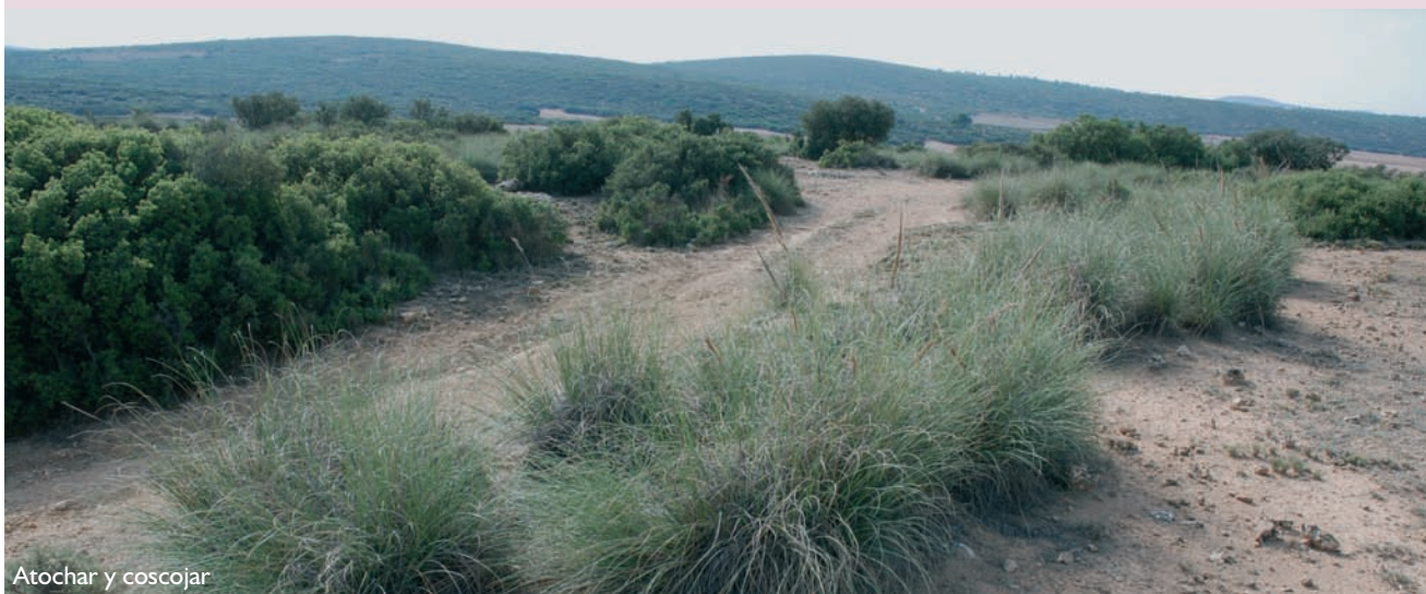
Atochar y coscojar

Época aconsejada de visita y otras recomendaciones: primavera y otoño. No hay visitas reguladas.