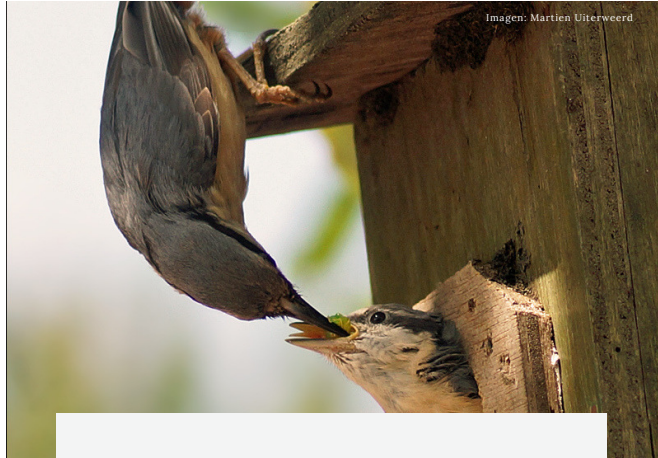
Imagen: Martien Uiterweerd